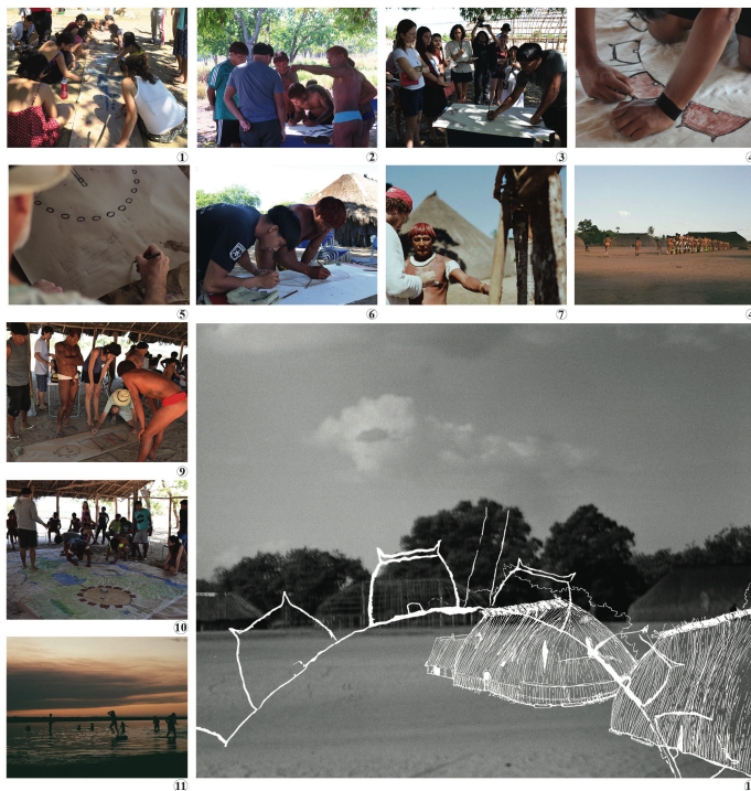
Prancha 01 – Encontro - Manual da Arquitetura Kamayurá - Julho 2019.