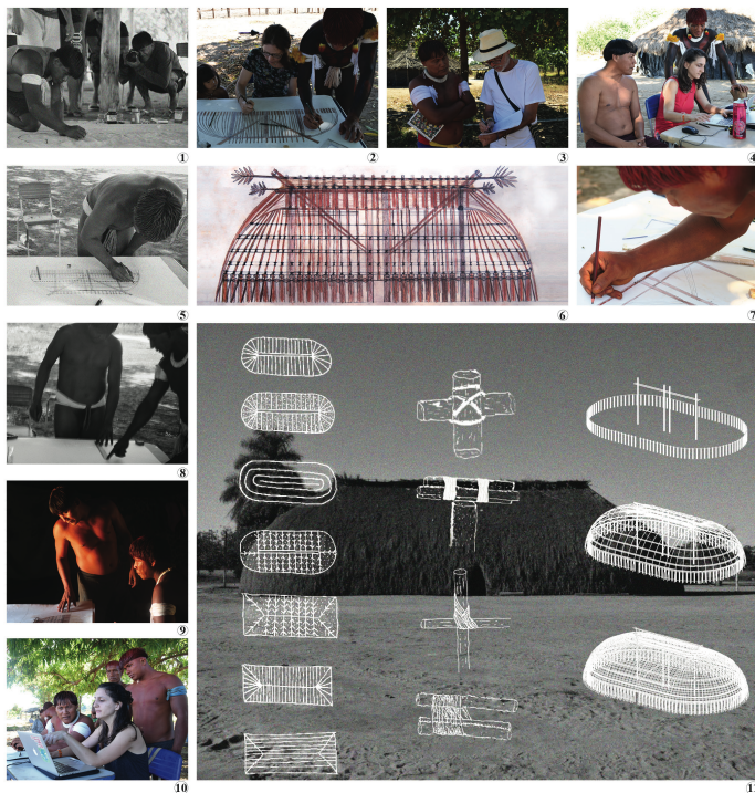
Prancha 03 – Manual - Manual da Arquitetura Kamayurá - Julho 2019.